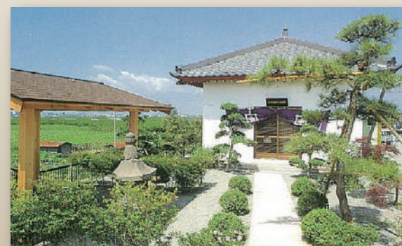
▲在万年桥右岸的 御硯水 (osusurimizu) (在经石上字用的水便是在这里取的)