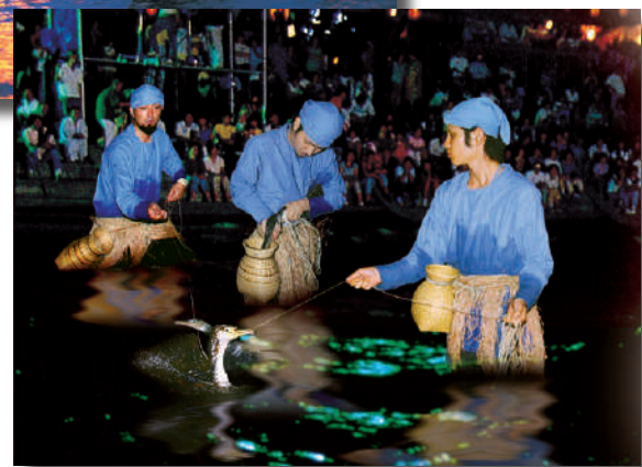
▶笛吹川的石和鵜飼 徒步鵜 (kachiu)