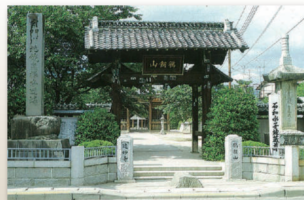
鵜飼山远妙寺 (ukaizanonmyoji) 的山門