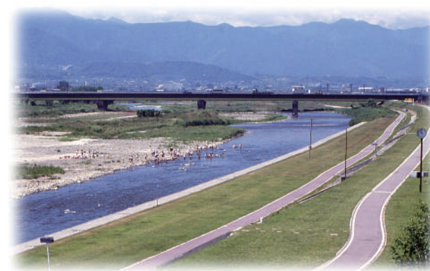
▲实行石和鵜飼的笛吹川 (当时流在这里的是石和川)