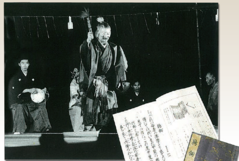
▲薪能 (takiginou) “鵜飼”的一个场面 鵜飼发源地—鵜飼山远妙寺 [重要无形文化财产保持者]

在这里，我们看看在石和如何开始鵜飼的。在平安时代后半期，甲斐国唯一的御厨 (mikuriya) 建在石和。御厨是为了捕鱼献给神，那里有捕鱼设施和捕鱼的渔场。当时认为鵜飼川是能捕到香鱼的渔场。这个渔场里采用的就是当时最一般的捕鱼方法—“鵜飼”。