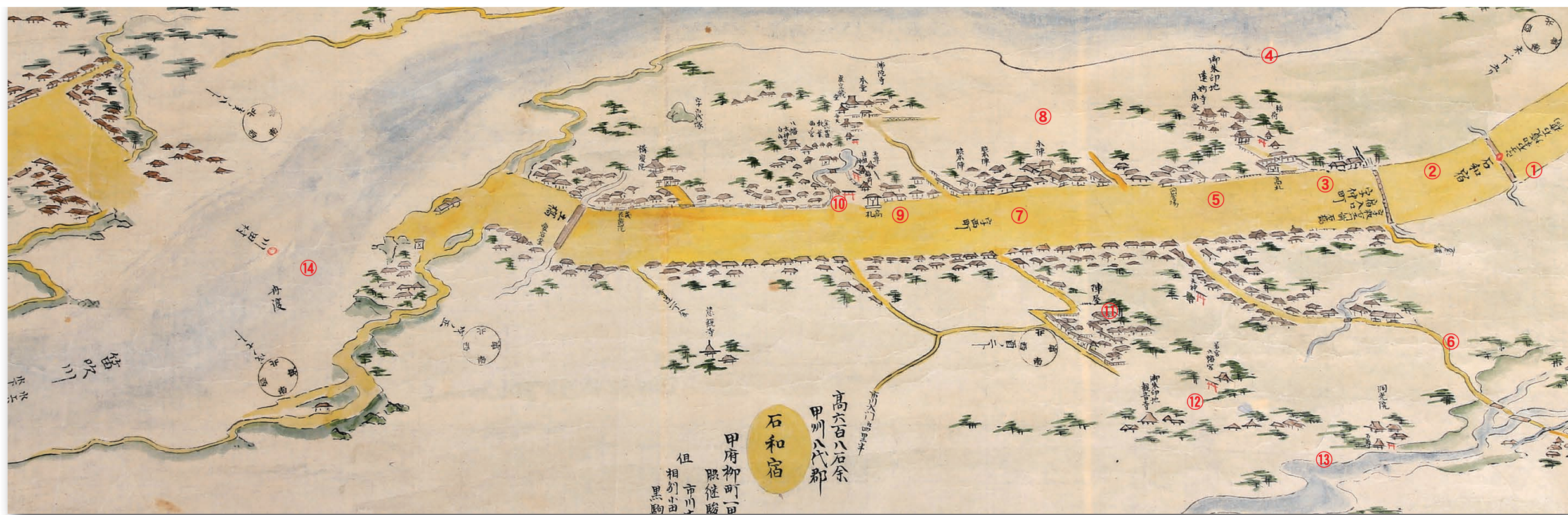
“甲州道中分间延绘图”里的石和宿周边（山梨县立博物馆藏）

从甲州道中再往西走是⑦字西町，北面是⑧本阵和胁本阵，西面是⑨高札场 (布告处)，那个旁边画着⑩ (石和) 八幡宫的鸟居。在本阵前南往下看，⑪ (石和) 兵营，⑫御朱印地观音寺，再往南的河是⑬石和川。