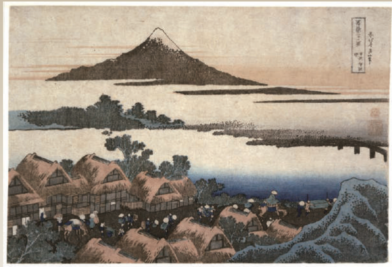
富岳三十六景“甲州伊澤暁 (isawaakatsuki)”