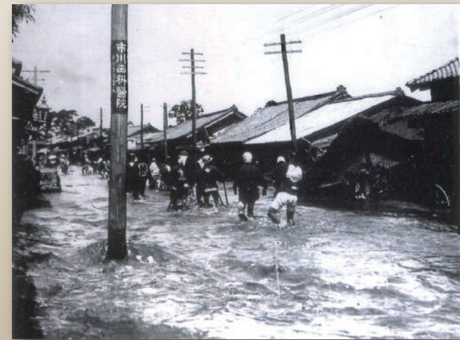
明治 40 年的大水灾造成了石和宿水淹。