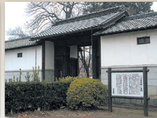
被移筑到八田家屋敷的石和代官所的正门