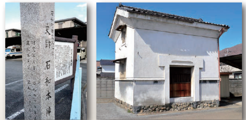
石和陈屋遗迹的石碑