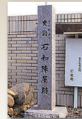
石和陈屋遗迹的石碑

⑪石和陈屋是宽文元年 (1661 年) 开设的石和代官所的建筑物。代官主要的任务是从所管的村庄收地租和掌管犯罪。现在石和代官所的旧址建成了石和南小学，当时的兵营已经没有了，只剩下校门的左边建造的石和陈屋遗迹石碑。