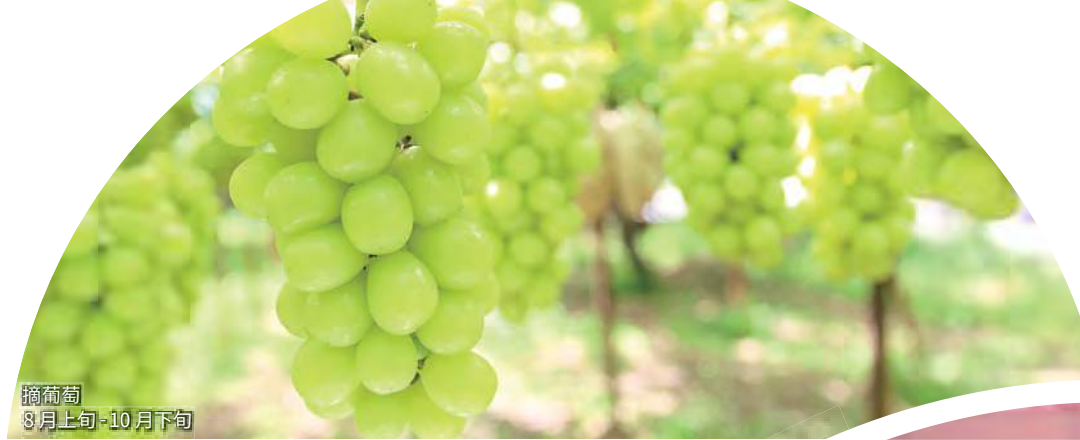
摘葡萄 8月上旬-10月下旬