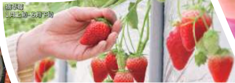
摘草莓 1月上旬-5月下旬