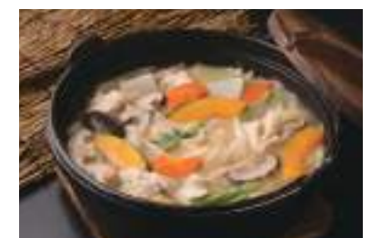
日本饮食文化和体验活动