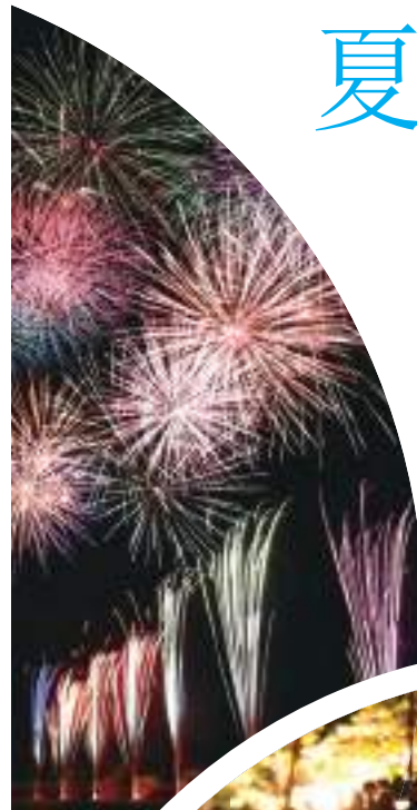
石和温泉鸕鹚捕鱼和烟花表演 & 石和温泉烟花节