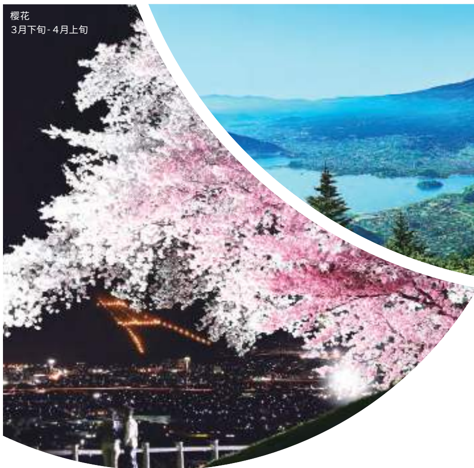
樱花 3月下旬 - 4月上旬