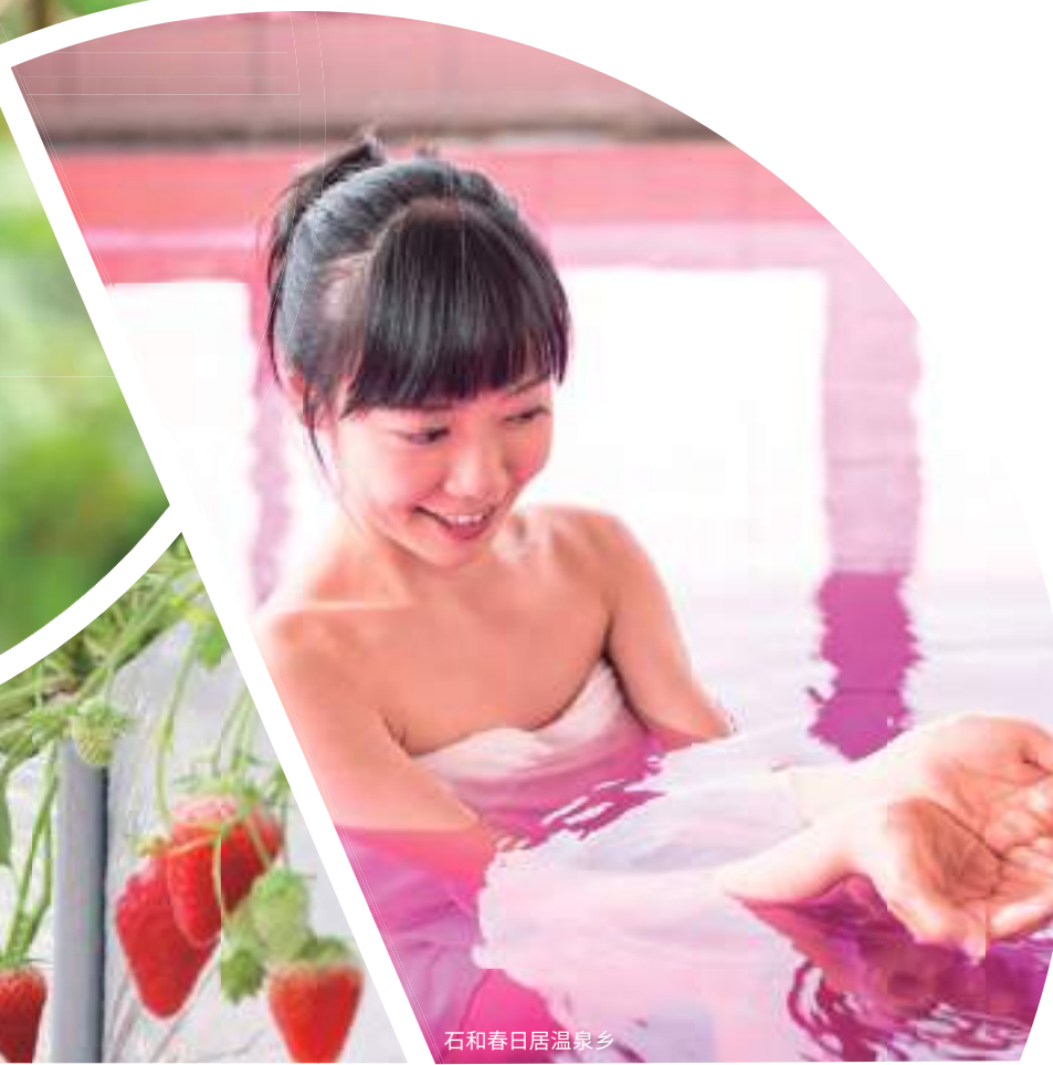
石和春日居温泉乡