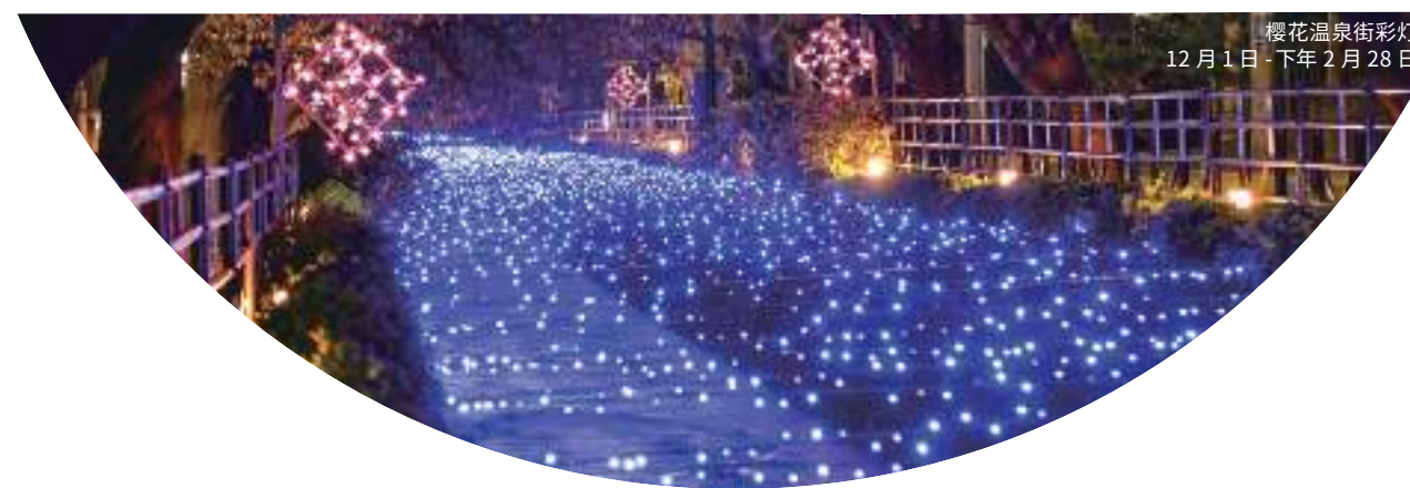
樱花温泉街彩灯 12月1日-下年2月28日

石和温泉和春日居温泉作为一个皮肤温润美丽的温泉在全国闻名，为山梨县的旅游住宿地点四季欢迎许多游客。