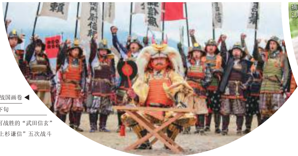
川中岛战场战国画卷