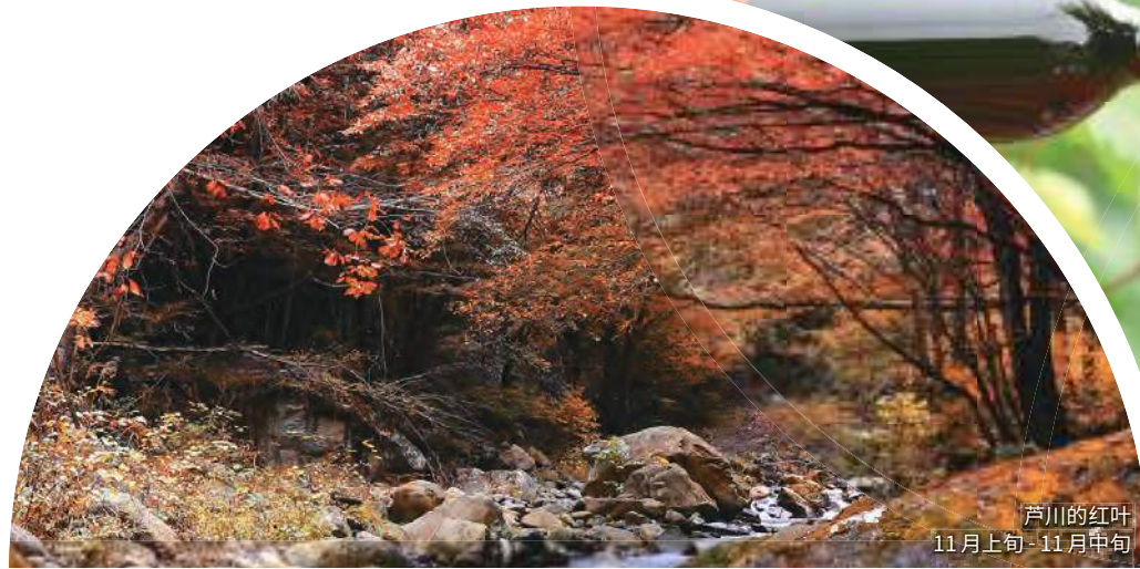
芦川的红叶 11月上旬-11月中旬