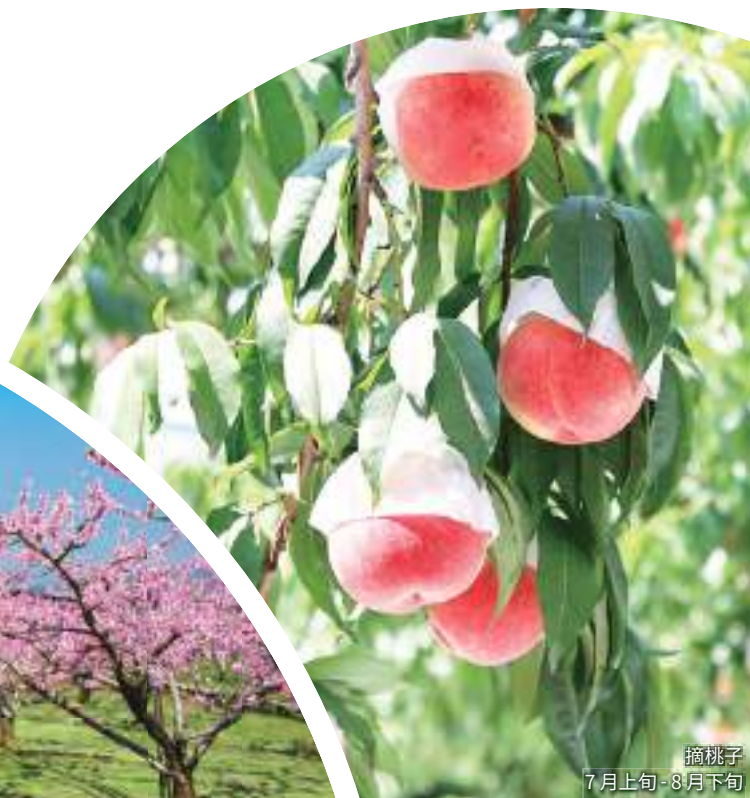
摘桃子 7月上旬 - 8月下旬