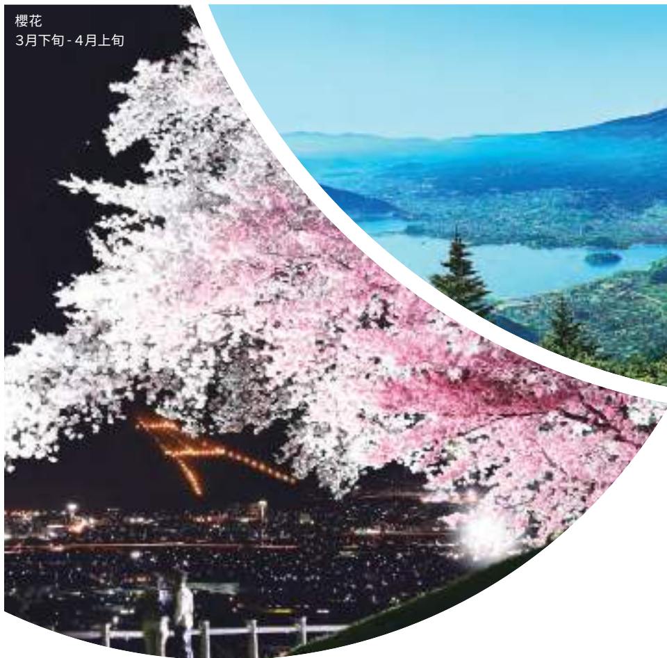
櫻花 3月下旬 - 4月上旬