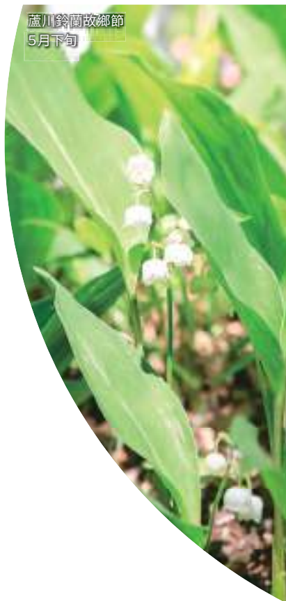
蘆川鈴蘭故鄉節 5月下旬