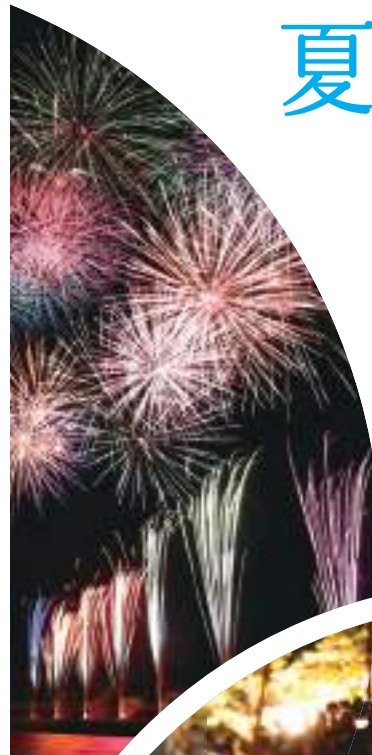
石和溫泉鸕鷀捕魚和煙花表演 & 石和溫泉煙花節