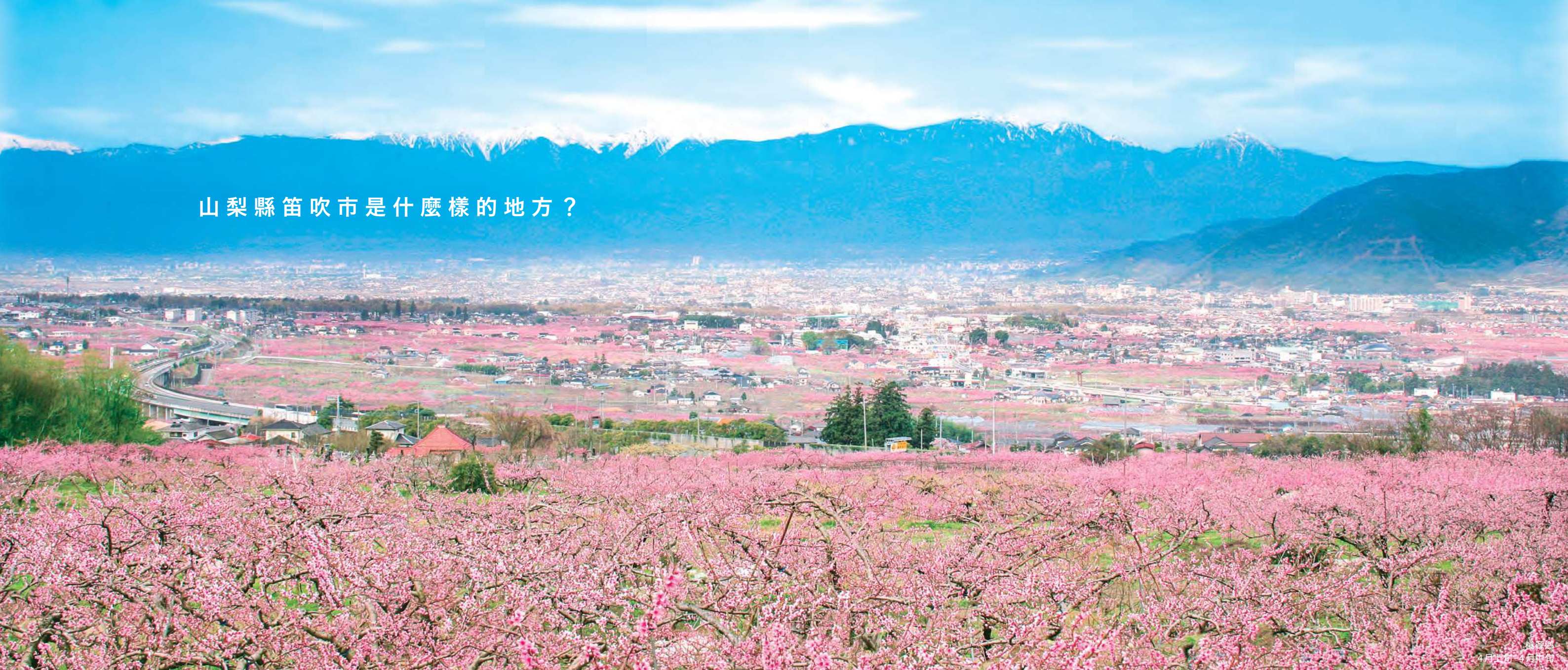
桃源鄉 4月上旬-4月中旬

笛吹市位於甲府盆地東側，離首都東京大約 100 公里，被稱為“桃子和葡萄日本最好的城市”，擁有石井春日居溫泉鄉，是一個果園和旅遊城市。