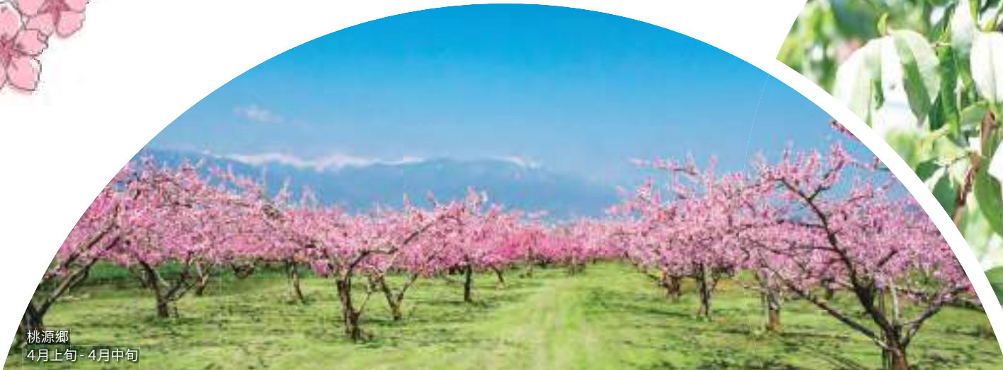
桃源鄉 4月上旬 - 4月中旬