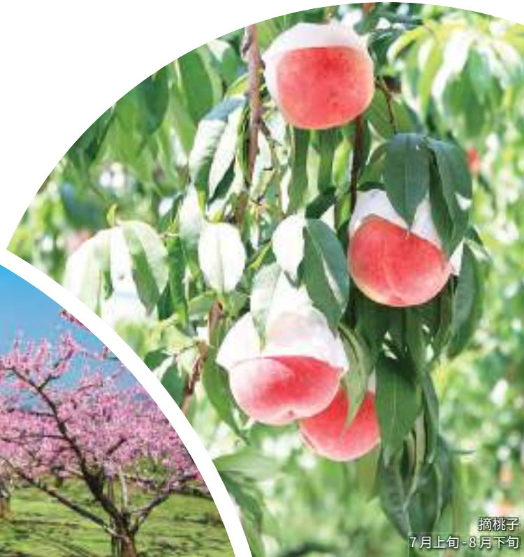
摘桃子 7月上旬 - 8月下旬